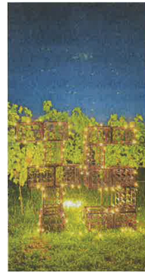
75 Jahre!

davon sind Steillagen. Die steil abfallenden Weinberge sind außerdem ein beliebtes Ausflugsziel und prägen die Landschaft der Region. Immer weniger Weinberge werden dort indes gepflegt, denn die Bewirtschaftung ist mühsam und aufwendig.