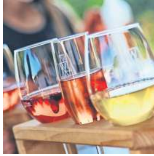
Mit dem beliebten Kelterfest feiern die Weingärtner am 6. und 7. September ihr 75-Jahr-Jubiläum.